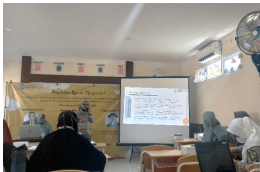
Gambar 8. Paparan Materi Kelima