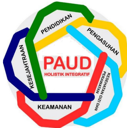
Gambar 1. Layanan PAUD Holistik Integratif

tentunya tidak terlepas dari berbagai dukungan penuh serta tanggung jawab dari orang tua, keluarga, sekolah, masyarakat, dan pemerintah. Pelaksanaan PAUD berbasis holistik integratif, sebaiknya dilakukan secara konsisten, teratur, terpadu, terintegrasi, dan berkelanjutan untuk memfasilitasi anak usia dini menjadi anak yang sehat, berkarakter, cerdas sebagai penerus bangsa yang berkualitas.