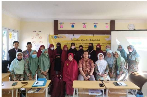
Gambar 3. Peserta Kegiatan Pengabdian pada Masyarakat (PPM)

Pelatihan ini merupakan bagian dari kegiatan Pengabdian pada Masyarakat (PPM) dengan menggunakan skema perkuliahan desa dalam bentuk pendampingan pada guru-guru TK di Kelurahan Sialang dalam membuat rencana pembelajaran berbasis holistik integratif. Kegiatan PPM ini dilaksanakan secara luring (tatap muka) dan daring (tatap maya). Pelaksanaan secara luring dilakukan di Lembaga Pendidikan Yayasan Yaa Bunayya Islamic School , karena sekolah tersebut memiliki ruang kelas yang memadai untuk diadakan pertemuan. Sedangkan, secara daring melalui aplikasi Google Meet untuk kegiatan sinkronus serta aplikasi WhatsApp untuk kegiatan asinkronus. Kegiatan ini diikuti oleh 12 (dua belas) orang guru TK di Kelurahan Sialang.